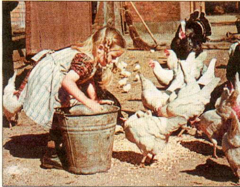
Auf dem Hühnerhof

So ist es also weit mehr als nur Nostalgie, wenn er in seinem zweiten