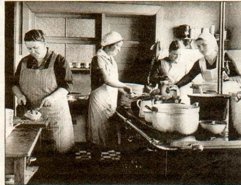
Hantieren mit „Pott un Pann“ in der Großküche

genheit zu geben, wieder aufzuleben. Die Bilder sind großformatig und erleichtern dadurch sehgeschwächten Menschen das Betrachten. Außerdem ist das Buch mit Spiralrücken gebunden, sodass es sich beim Aufblättern nicht von selbst schließt.