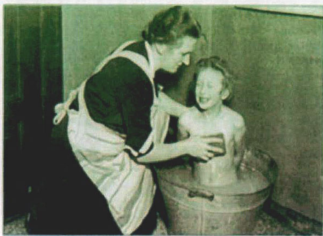
Waschtage in der Zinkwanne: An Szene wie diese können sich noch viele Senioren erinnern.