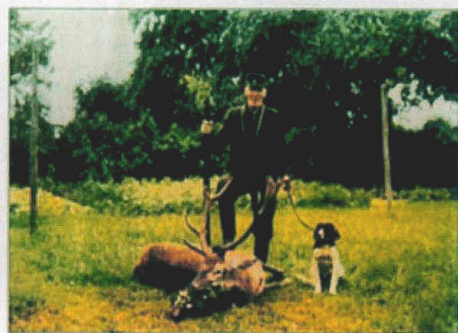
Stölzer Jäger: Das Bild aus dem zweiten Band zeigt ein Motiv, das bei Männern Erinnerungen wecken kann.